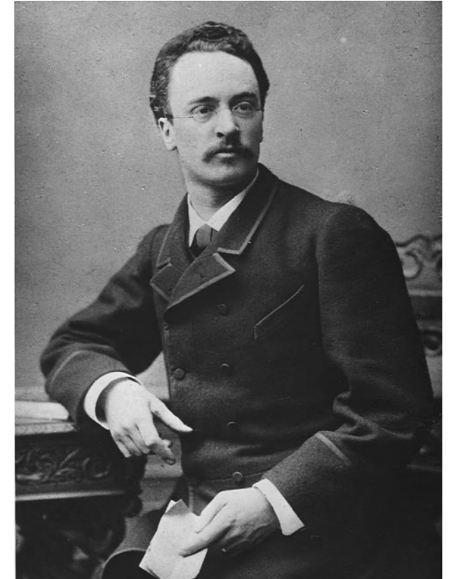
Rudolf Diesel (1858 – 1913) im Jahr 1883. Zu dieser Zeit arbeitete der junge Ingenieur als Repräsentant der Linde-Gesellschaft in Paris.

Nach der Jahrhundertwende wurde der sensible Rudolf Diesel von Rückschlägen zermürbt. Kunden schickten Motoren zurück, weil einzelne Teile wie Luftkompressor und Siebzerstäuber noch nicht robust genug waren. Konkurrenten verwickelten ihn in kräftezehrende Patentprozesse. Schneller als sein Vorbild Linde wurde Diesel reich – und genau so schnell verspielte er wieder seine Millionen bei erfolglosen Firmengründungen und -beteiligungen. Am 29. September 1913 ging Rudolf Diesel in Antwerpen an Bord eines Postdampfers, um nach Harwich überzusetzen. Am nächsten Morgen wurde er vermisst. Wochen später wurde seine Leiche gefunden. Wahrscheinlich hat der nervlich zerrüttete und finanziell ruinierte Rudolf Diesel Suizid begangen.