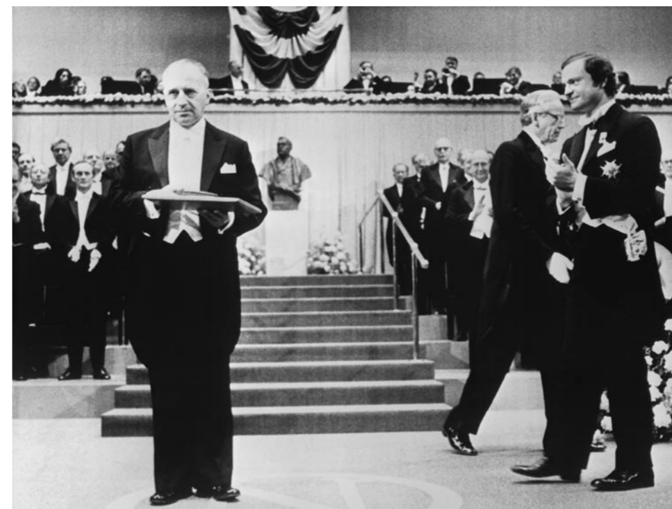
Professor Ernst Otto Fischer (1918 – 2007) wurde am 10. Dezember 1973 in Stockholm der Nobelpreis für Chemie von Schwedens König Carl XVI. Gustav überreicht.